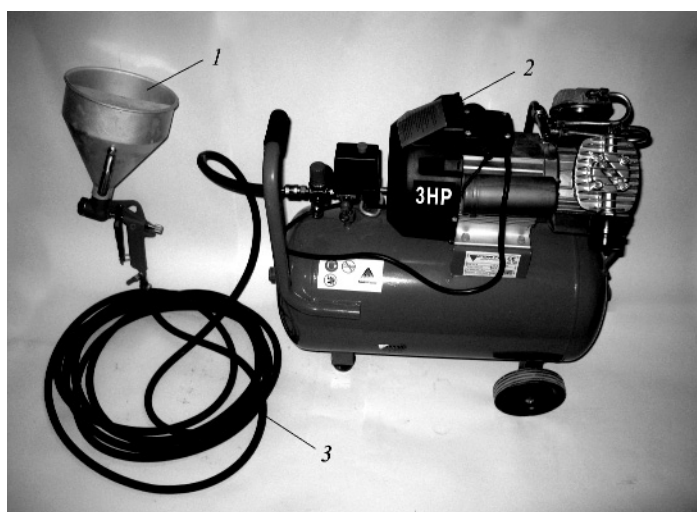
Рис. 4. Комплект технологічного обладнання, яке використовується для виготовлення тонкостінного покриття й замоноличування стиків тонкостінних елементів: 1 – бункер-пістолет; 2 – пересувний компресор; 3 – шланг пневматичний

При застосуванні способів сухого й мокрого торкретування набризк може вестися як у ручному, так і в механізованому режимі за допомогою маніпуляторів. У зв'язку з тим, що при застосуванні способу сухого торкретування найчастіше мова йде про невелику продуктивність і встатку-