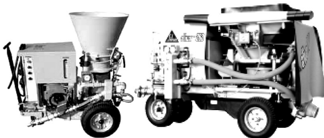
Рис. 5. Устаткування для сухого торкретування: а) – Aliva-246.5 "базова" версія; б) – Aliva-263 "удосконалена" версія

вання для торкрет-бетонних робіт, ручний набризк використовується значно частіше. Суха дрібнозерниста бетонна суміш наноситься, головним чином, за допомогою роторних машин.