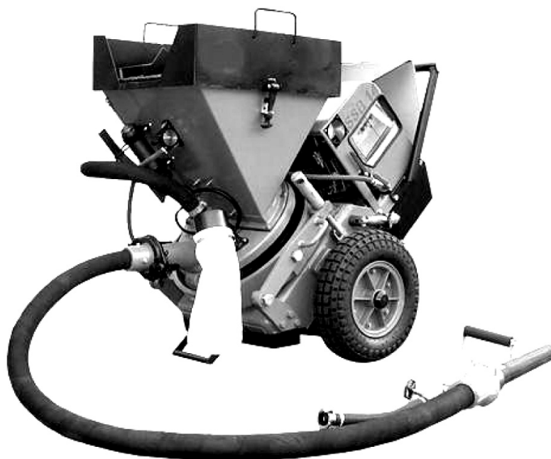
Рис. 6. Торкрет-установка АС-1

практического применения / В. Я. Бабиченко, В. И. Данелюк // Зб. наук. пр. "Будівельні конструкції". – Вип. 72. – Київ: НДІБК, 2009. – С. 622-630.