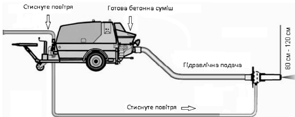
Рис. 2. Гідравлічна подача суміші при способі мокрого торкретування

При застосуванні способу мокрого торкретування процес початку робіт (готування суміші, її доставка до насоса) і процес завершення роботи (очищення встаткування) є більш трудомісткими, ніж при використанні способу сухого торкретування. Крім цього, при способі мокрого торкретування час використання приготовленої суміші обмежені й бетонна суміш повинна бути нанесена за