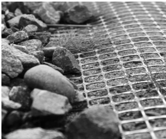
Рис. 3. Приклад встановлення геосітки