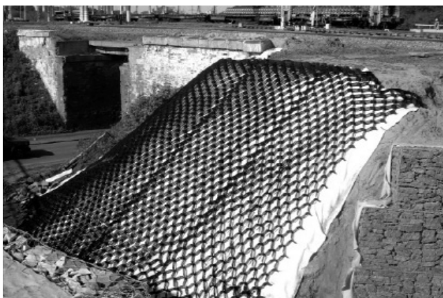
Рис. 1. Приклад влаштування геотекстилю на схилі