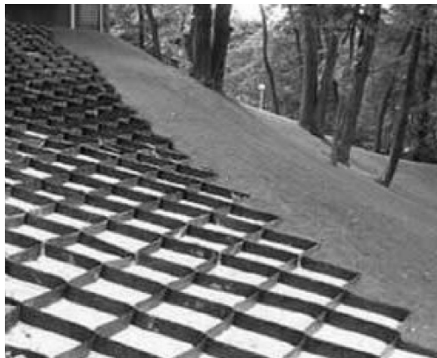
Рис. 4. Приклад встановлення георешітки