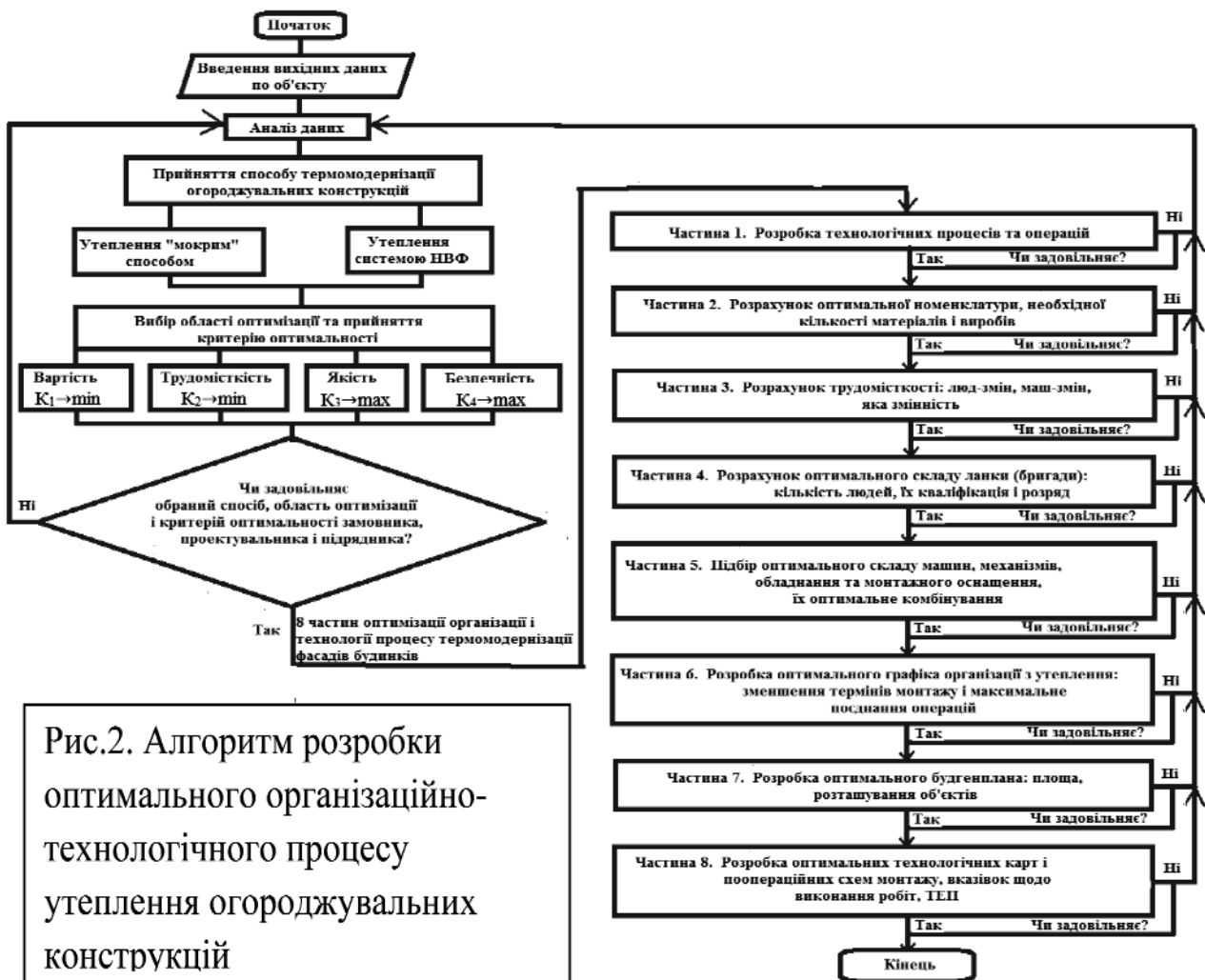
Рис.2. Алгоритм розробки оптимального організаційно-технологічного процесу утеплення огорожувальних конструкцій