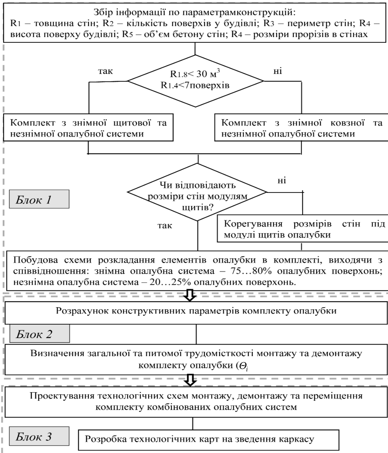
Рис. 1. Блок-схема методики формування комплектів комбінованих опалубних систем для зведення конструкцій каркасів будівель

де: N_s – питома кількість збірних елементів у комплекті опалубки з урахуванням кількості по-