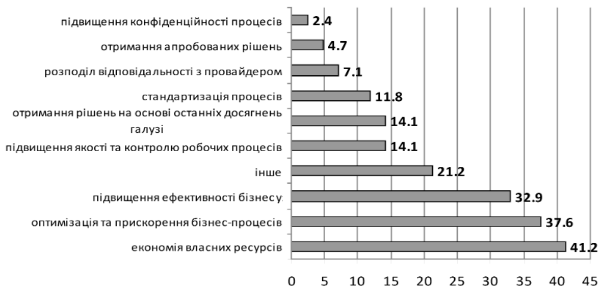
Рис. 2. Переваги аутсорсингу для підприємств України, %