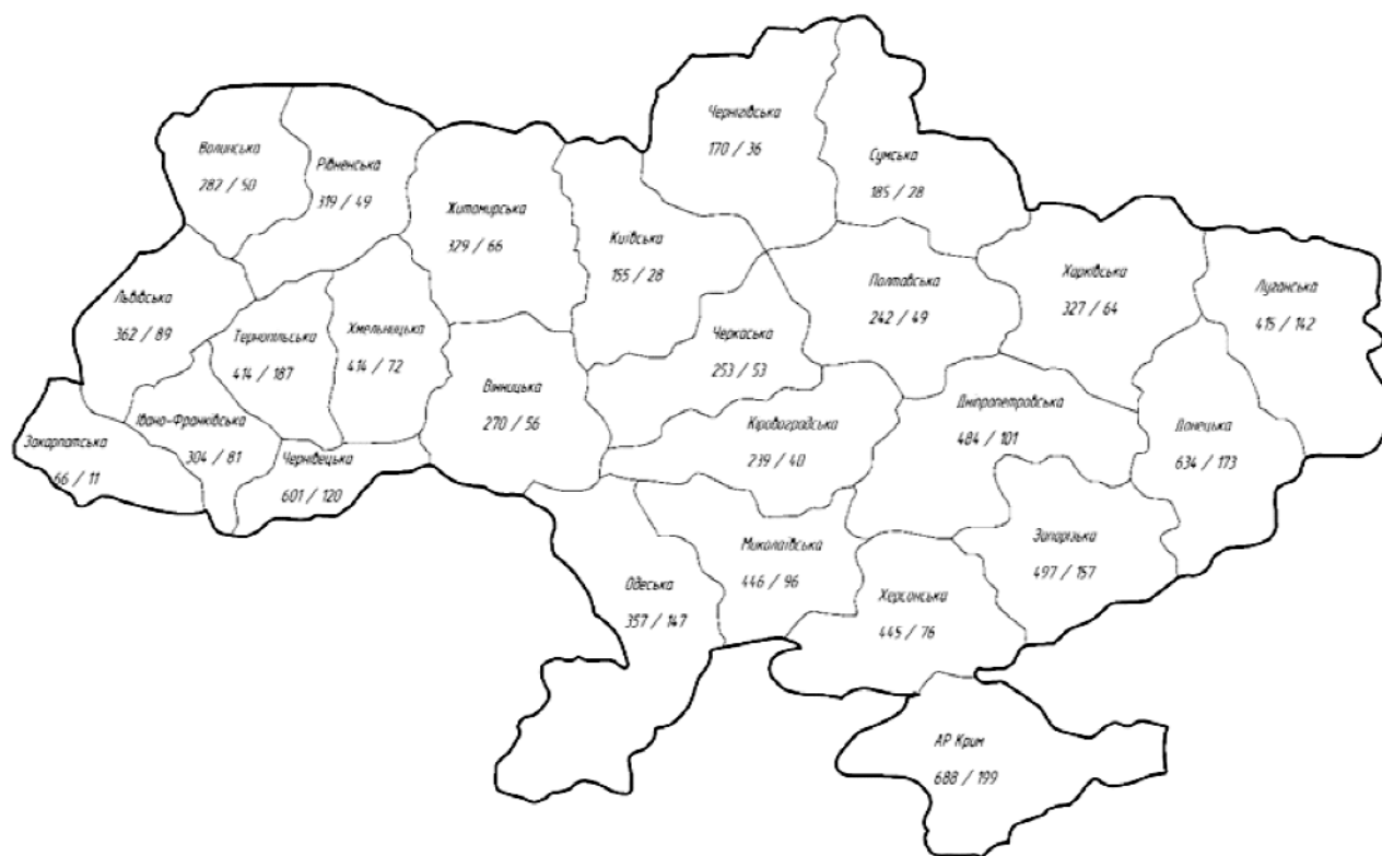
Рис 2. Районування території України за імовірною річною тривалістю простоїв монтажних кранів (у годинах) при перевищенні швидкості вітру 10 м/с та 14 м/с

Порівняння отриманого часу простоїв з рисунком 1 вказує на незначне завищення порівняно фактичними даними для метеостанції м. Кропивницький. Урахування тривалості дії сильних вітрів дозволить більш точно спланувати монтажні роботи з урахуванням можливих простоїв кранів під час їх проведення.