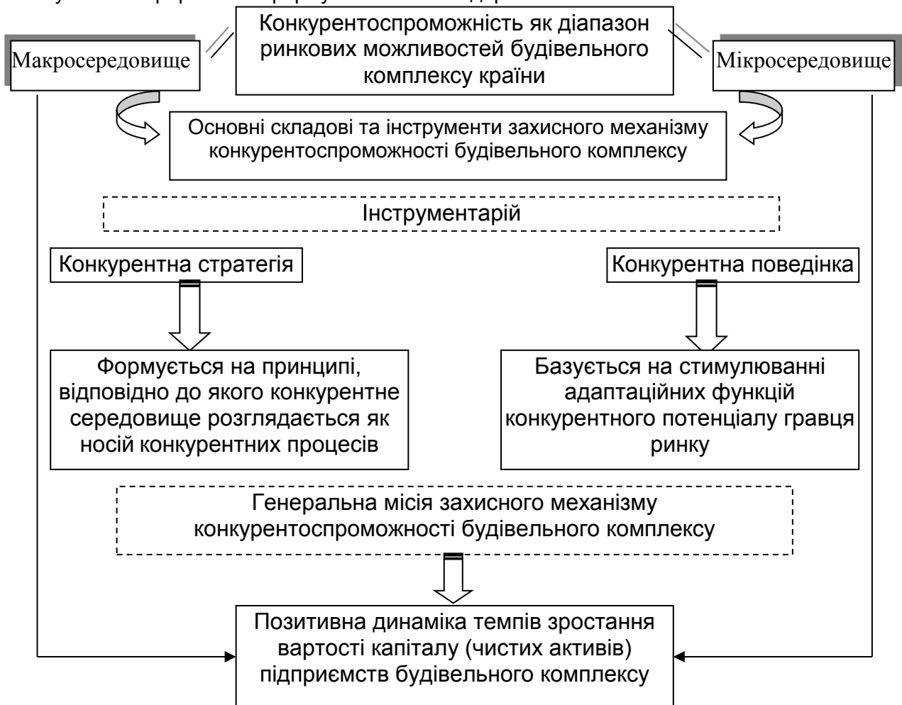
Рис. 3. Захисний механізм конкурентоспроможності на макро- та мікрорівні

Дотримуємось бачення, що підприємства виступають провідною ланкою процесу забезпечення конкурентоспроможності галузі, комплексу, кластеру. Базовий попереджувальний індикатор захисного механізму конкурентоспроможності підприємства – концепція вартості бізнесу добирає все більше прихильників. Це пов'язано з тим, що показник ринкової вартості підприємства є важливою комплексною оцінкою ефективності його діяльності, яка відбиває якість менеджменту, поточне фінансове благополуччя і майбутні фінансові очікування власників підприємства.